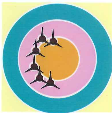
Sortir le BB