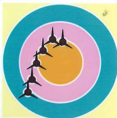
Assouplir le ressort