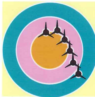
Durcir le ressort